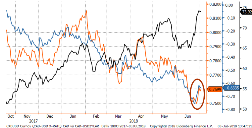
Graphique 4. Taux CADUSD (bleu), prix du pétrole (noir) et différentiel de taux d'intérêt (orange)

Ailleurs, nous attendons les chiffres d'emplois canadiens vendredi où les analystes s'attendent à une création de 20,000 nouveaux postes. Le chiffre prend une importance particulière ce mois-ci compte tenu de la rencontre de la Banque du Canada le 11 juillet tel que mentionné ci-haut. La BdC espère une amélioration par rapport aux emplois décevants du mois passé où 7,000 postes avaient été supprimés.