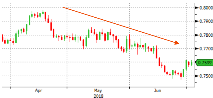
Graphique 1. Dollar canadien

Selon Raymond Bachand, négociateur en chef du Québec et ancien ministre des Finances, le ralentissement des négociations a été causé par le représentant du commerce des États-Unis, Robert Lighthizer, qui a décidé d'arrêter soudainement les discussions sur les 30 tables de négociations pour se concentrer uniquement sur le secteur automobile. Ce secteur pose davantage problème entre le Mexique et les États-Unis, ce qui a forcé le Canada à attendre lors de ces discussions. Toujours selon ce dernier, les équipes de négociations venant des É-U n'auraient pas de mandats clairs venant du président ce qui compliquerait les négociations.