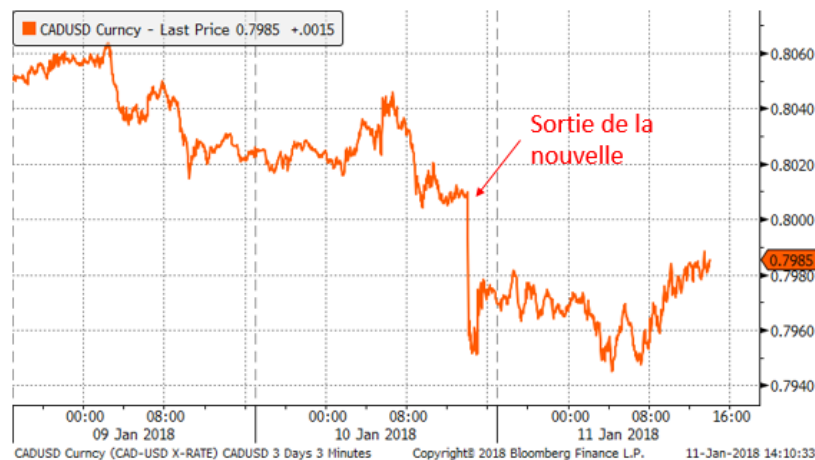
Graphique 2. Taux CADUSD

Le dollar canadien a été assez volatile cette semaine surtout en ce qui concerne la fameuse dispute concernant l'ALÉNA. Deux membres du gouvernement canadien ont mentionné sous le couvert de l'anonymat que le Canada se préparait pour une éventuelle sortie des États-Unis de l'entente nord-américaine. Cette nouvelle a eu un effet négatif sur le dollar canadien qui jusqu'à présent avait pris beaucoup d'avance suite à de bonnes données économiques (inflation, emplois, indicateurs de confiances). L'histoire est venue brimer les attentes que le marché eût bâti par rapport à la hausse de taux d'intérêt prévue le 17 janvier. Maintenant, on se demande si la Banque du Canada voudra agir en faisant face à cette incertitude politique. Les probabilités d'une hausse demeurent quand même à 78% comparées à 90% en début de semaine.