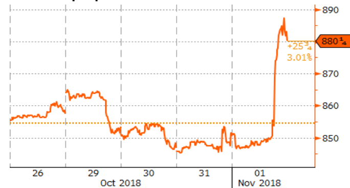
Graphique 1. Prix de la fève cette semaine

S F9 Comdty (SOYBEAN FUTURE Jan19) oil intraday chart 5 Days Tick Copyright© 2018 Bloomberg Finance L.P. 01-Nov-2018 14:54:01