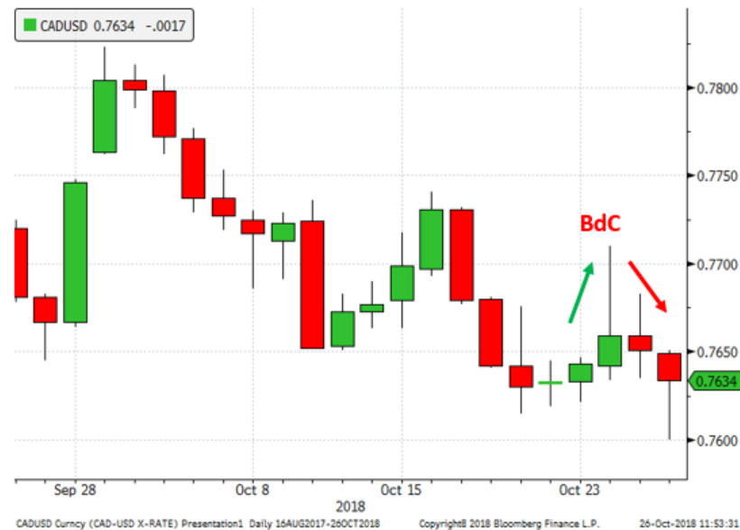
Graphique 3. Dollar Canadien cette semaine

Mercredi, la Banque du Canada (BdC) a choisi d'augmenter son taux directeur de 25 points de base à 1.75%, tel que prévu, en mentionnant quelques facteurs qui ont aidé à sa décision. Elle a mentionné que la croissance économique mondiale et la croissance américaine demeureraient solides en rajoutant que le nouvel accord AEUMC a grandement aidée à améliorer la confiance et l'investissement des entreprises malgré qu'il reste encore de l'incertitude face à la relation entre les É-U et la Chine. En ce qui a trait à l'économie canadienne, la BdC a mentionné que la croissance était près de sa pleine capacité, que le nouvel accord trilatéral devrait être positif pour les entreprises et que l'inflation devrait rester près de sa cible de 2%; tous des facteurs positifs. Une des contraintes majeures demeure toujours l'endettement des ménages face l'augmentation des taux d'intérêt. Le dollar canadien a initialement augmenté de 70 points à 77.10 suivant la nouvelle, mais n'a pas pu maintenir ses gains.