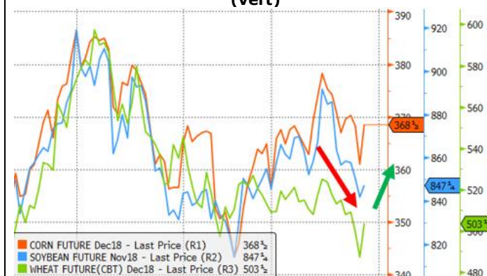
Graphique 1. Prix du maïs (orange), fève (bleu) et blé (vert)